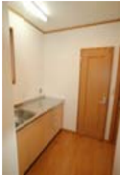
△二世帯住居と言うことで2Fにはキッチンを設置しました。

建主様が、入母屋屋根にこだわりを持ち中は、和洋折衷ということで和のテイストを持たせつつ洋の空間も演出する様にと心掛け施工致しました。そこで、間取りにも入母屋が似合う間取りに配置したり縁側などを取り入れる等細かい所まで気をくばりました。