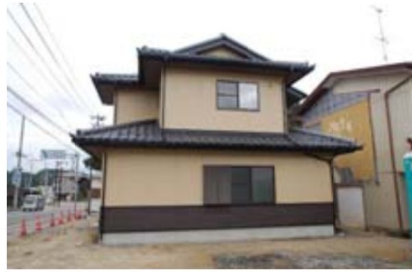
△ 右の写真だとわかりにくいですが側面から見ると入母屋の形がわかります。 腰壁に木目調のサイディングも貼り和風を強調しています。