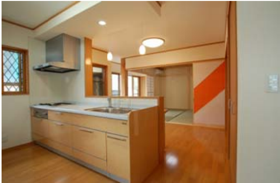
△キッチンも床材と同じオレンジ調の面材を使用し一体感ある空間ができました。キッチンブランドはベルテクノ