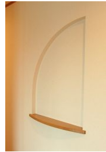
△玄関入口には、お洒落な飾り棚があり ちょっとした物が空間を豪華に演出します