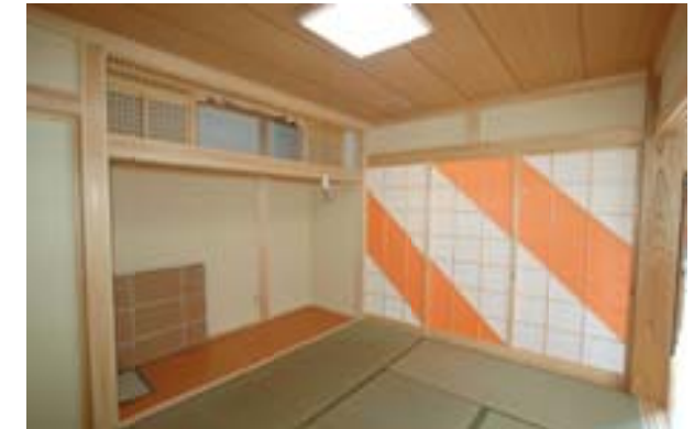
△和の障子に大胆な斜めのオレンジのストライプラインを入れちょっと変わった空間も演出しました