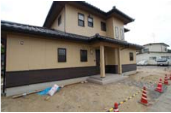
△入母屋屋根を活かす為に、2Fを入り組んだりする様に配置しました 外観も落ち着いた色合いに統一しました。