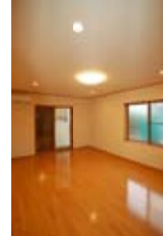
△【寝室の写真】主の電灯の 他にダウンライトで夜も違う空間を 演出する様にしました