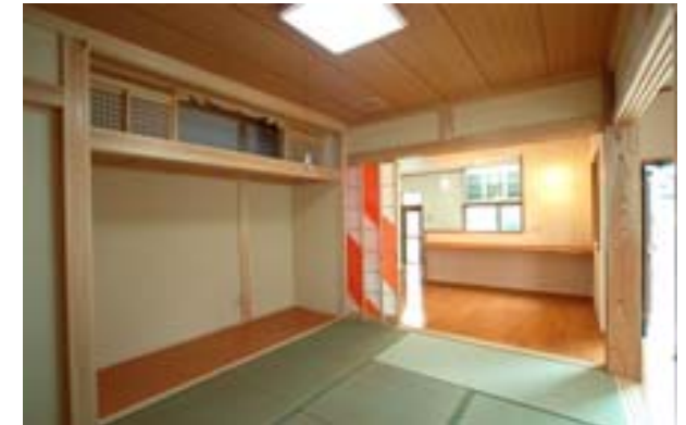
最近、当社でお客様からの希望が多い LDK + 和の空間を 3本引戸などで区切る事です。戸を開けると 広々とした空間が広がりますのでこれが人気の理由ですね