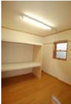
△手前に布団等を置く棚、奥には パイプを取付使い勝手が抜群