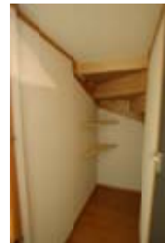
△階段裏の収納スペース部分で すコーナー棚を設置