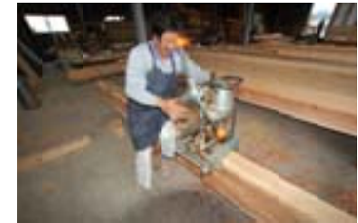
▲ 当社の大工の墨付け、刻み、加工の風景と ケヤキの柱を搬入した時の写真です。作業場が満杯になり大変でした