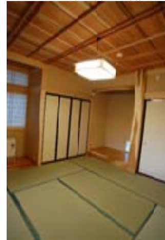
▽天井は、職人芸あふれる羊縁天井